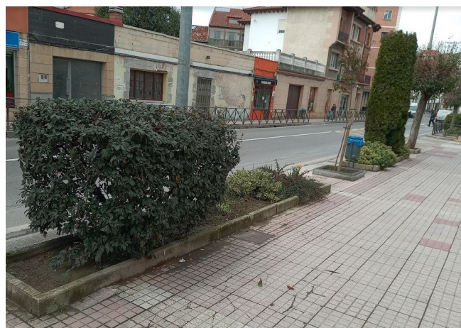
Parterre III de 5,50 m 2 aprox. (7 Verde claro)