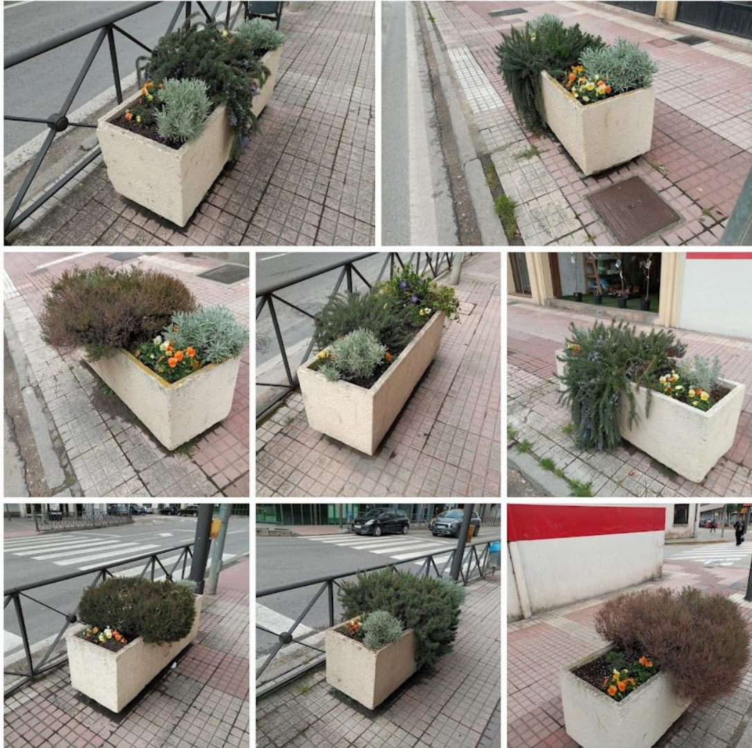
Parterres I y II de 5,50 m 2 cada uno aprox. (6 Verde claro)